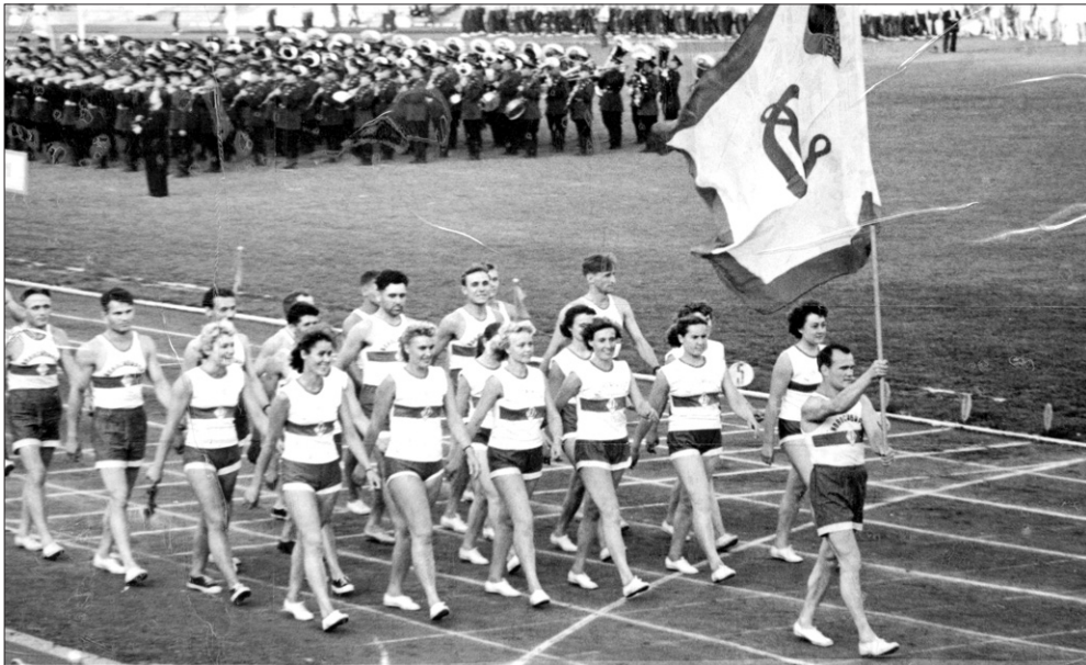
1958 год. Спартакиада общества «Динамо».

Всероссийскому физкультурно-спортивному обществу «Динамо» исполнилось 90 лет.