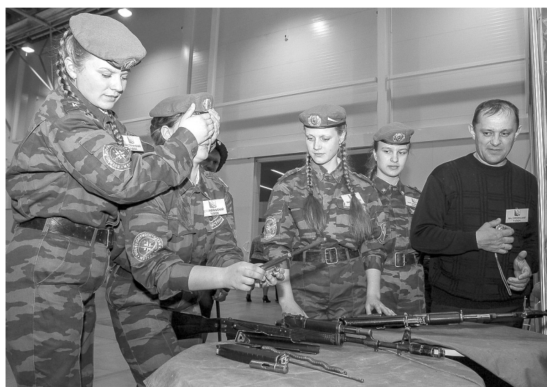
Воспитанницы военно-патриотического кружка «Исток» из села Большой Изырак собирают автомат с закрытыми глазами.

В круглом столе «Роль СМИ в продвижении традиционных духовных и семейных ценностей» приняли участие главные редакторы районных газет, члены Общественной палаты Новосибирской области, а также представители общественных организаций, занимающихся вопро-