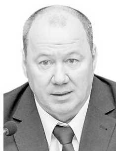
Александр МОРОЗОВ, первый заместитель председателя заксобрания:

Вчера сессия заксобрания утвердила уточнённый план реализации наказов избирателей депутатам пятого созыва на 2013 год. Бюджетные расходы составят 8 млн 463 тысячи рублей, что в 2,2 раза больше плана 2012 года. Как законодатели оценивают систему работы с наказами и надо ли в ней что-то менять?