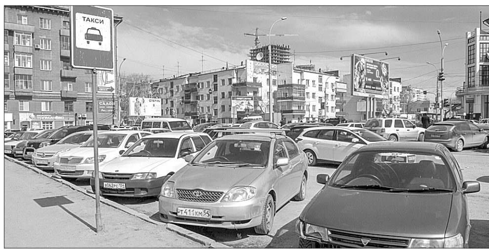
А чьи машины припаркованы на привозкальной стоянке, предназначенной, если верить знаку, для такси?

стве опознавательного фонаря легкового такси и нанесение на наружные поверхности цветографической схемы. За это нарушение предусмотрен штраф: с граждан — 2,5 тысячи рублей, с должностных лиц — 20 тысяч рублей, с юридических лиц — 500 тысяч рублей. Помимо этого, государственные регистрационные знаки снимаются до устранения причины запрещения эксплуатации, а незаконно установленный фонарь конфискуется. За управление таким транспортным средством водителю грозит штраф пять тысяч рублей. В компетенцию сотрудников госавтоинспекции входит контроль за законностью установки опознавательных фонарей и наносимой цветографической схемы такси, а также за получением разрешения на таксомоторные перевозки.