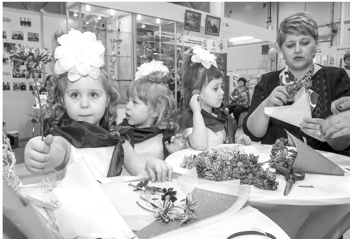
Самые юные участницы форума оформили подарочные букеты от «Союза женщин Новосибирской области».

Подготовила Марина ШАБАНОВА